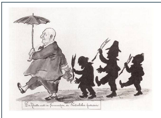
Bruckner en zijn criticasters, sportprent door Otto Böhrer (1847 – 1913)

De première van het werk vond uiteindelijk plaats op 18 december 1892. De eerste uitvoering van de Achtste Symfonie, door de Wiener Philharmoniker onder leiding van Hans Richter, was minstens zo'n groot succes als de première van de Zevende was geweest. Muziekcriticus Hugo Wolf schreef: "een volledige zege van het licht over de duisternis". Zelfs de gevreesde criticus Hanslick was verrassend mild. Ondanks termen als 'verwarde-kattengejankstijl' erkende hij (zij het indirect) de grootsheid van het werk.